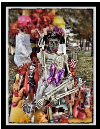
James Burgett, Altar , photograph

La primera visualización de los altares en el cementerio será el miércoles 1º. de noviembre de las 5 pm a las 9