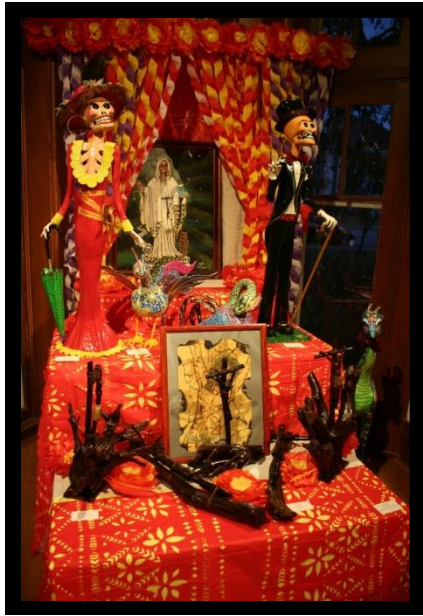
Adan Utrera, Altar , 2012