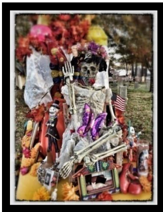
James Burgett, Altar , photograph

Miembros del público verán los altares en el cementerio el viernes 1º de noviembre durante el Festival del Día de los Muertos de las 5:00 hasta las 9:00 de la tarde.